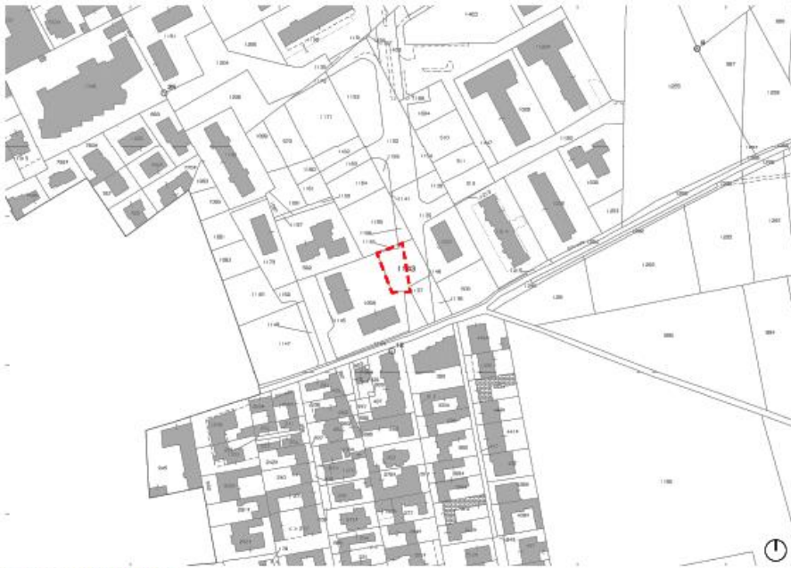
Stralcio catastale - foglio 1 p.la 1143