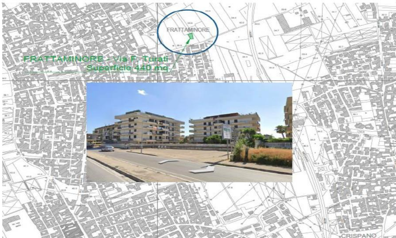
Figura 1. Collocazione territoriale area di intervento

Si riportano di seguito alcune foto aeree per l'individuazione dell'area oggetto dell'intervento.